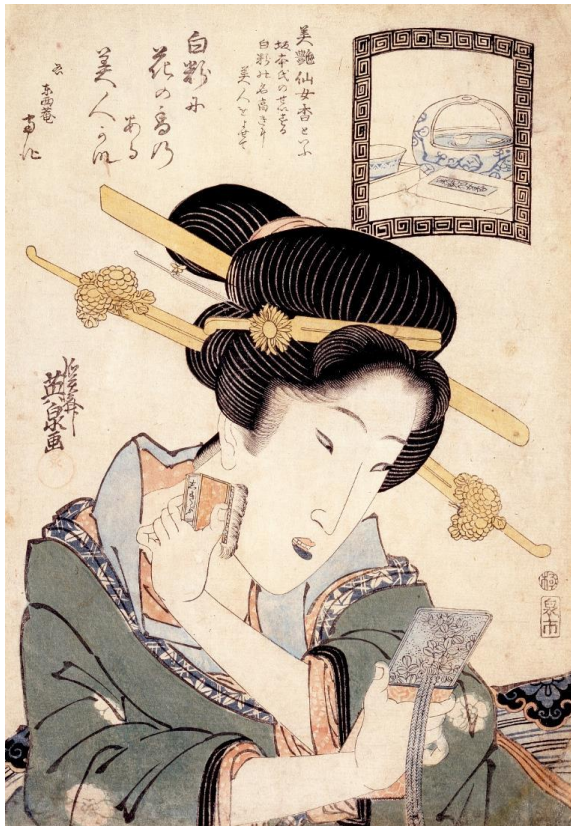
溪斎英泉《美艶仙女香志きぶ刷毛》文化 12-天保 13 年（1815-1842）

ここで、ポーラ文化研究所所蔵の浮世絵《美艶仙女香志きぶ刷毛》を例に、化粧文化の視点で実際に読み解いてみたい。